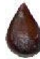
Pépin de pomme