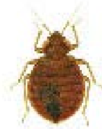
Punaise de lit

Brune et plutôt luisante, elle ressemble à un pépin de pomme