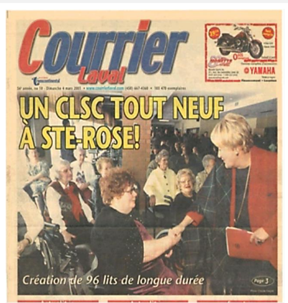
Le Courrier Laval, 4 mars 2001