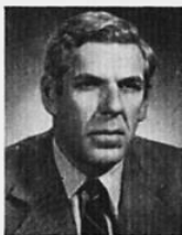
CLAUDE CASTONGUAY ministre des affaires sociales

"L'approche nouvelle des services communautaires que constituent les CLSC se veut un défi tant pour le ministère des Affaires sociales que pour les personnes et les divers groupes impliqués".