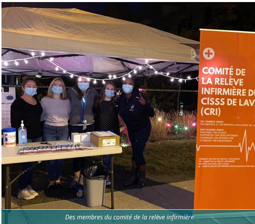
Des membres du comité de la relève infirmière