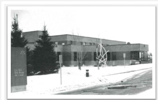
Deuxième CLSC Sainte-Rose 280, boulevard du Roi-du-Nord, 1982

À cette époque (1981-1982), le CLSC Sainte-Rose fonctionnait avec un budget global de 2 473 740 $, 80 personnes à temps plein et 78 autres à temps partiel y travaillaient.