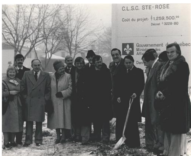
Première pelletée de terre du futur CLSC Sainte-Rose de Laval par monsieur Bernard Landry, ministre d'État au Développement économique, 1980

« En 1974, avec l'avènement du module social, du service de prévention et de l'accroissement des archives, le problème des locaux se pose de façon sérieuse. À la suite d'une étude [...] il a été décidé en 1975, de construire un nouveau CLSC. Ce n'est qu'en juillet 1978 que le terrain fut finalement acheté au coût de 80 000 $.