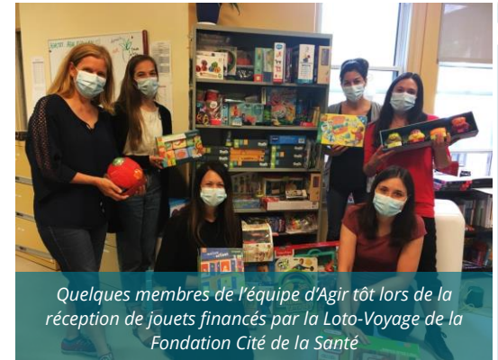
Quelques membres de l'équipe d'Agir tôt lors de la réception de jouets financés par la Loto-Voyage de la Fondation Cité de la Santé