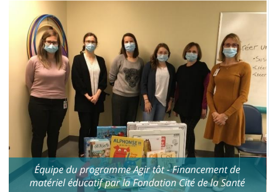
Équipe du programme Agir tôt - Financement de matériel éducatif par la Fondation Cité de la Santé

Pour bénéficier de ce service, l'enfant doit être âgé de moins de 6 ans au moment de la demande et ne pas avoir reçu de diagnostic le rendant admissible à d'autres services spécialisés.