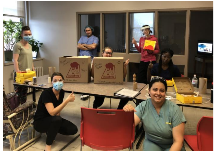
Livraison de poulet Saint-Hubert au Centre d'hébergement