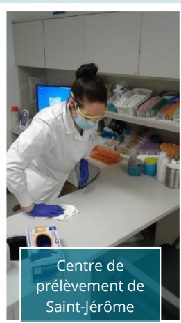
Centre de prélèvement de Saint-Jérôme