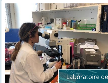
Laboratoire de Rivière-Rouge