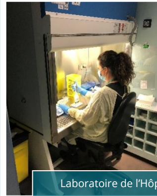
Laboratoire de l'Hôpital de la Cité-de-la-Santé

Un remerciement particulier aux technologistes et microbiologistes qui sont hautement sollicités pour la conception du test, mais aussi à l'ensemble de l'équipe travaillant dans les laboratoires et dans les centres de prélèvements au quotidien pour leur engagement dans la lutte à la COVID-19. Continuez votre bon travail!