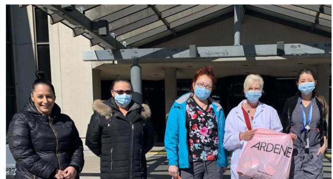
Dons de chaussures et chaussettes pour le personnel en psychiatrie et pédiatrie par la compagnie Ardène