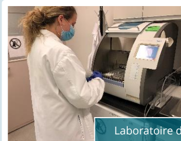
Laboratoire de Saint-Eustache