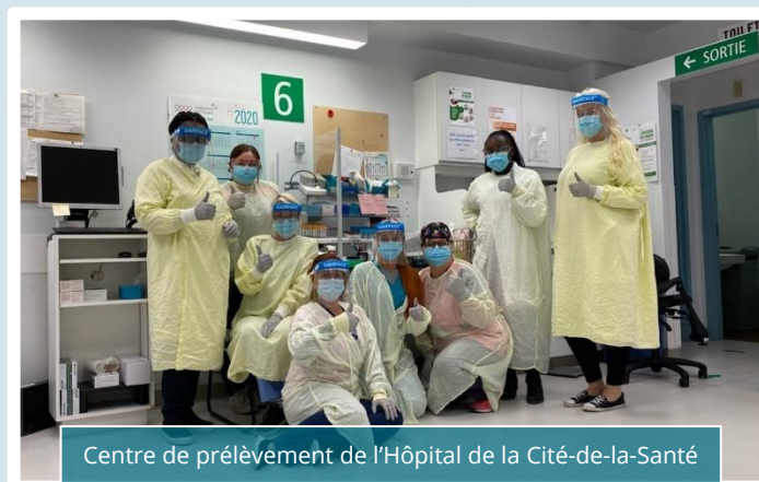
Centre de prélèvement de l'Hôpital de la Cité-de-la-Santé