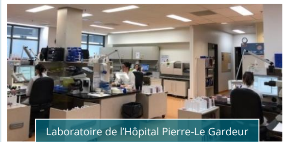
Laboratoire de l'Hôpital Pierre-Le Gardeur