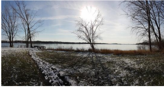
Rivière-des-Prairies vue depuis la berge de St - François