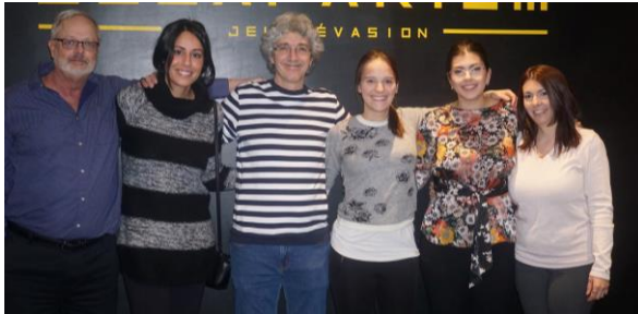
Notre équipe en pleine activité de groupe !