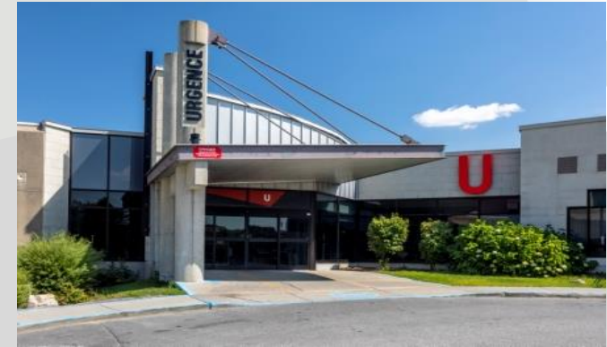
Hôpital de la Cité-de-la-Santé