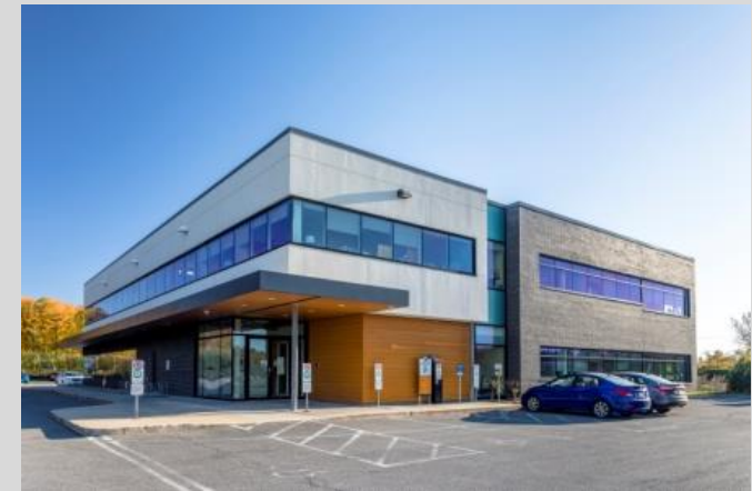
CLSC de l'Ouest de l'Île