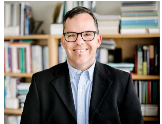
Dr Jean-Pierre Trépanier, directeur de santé publique

Pour la saison 2019-2020 et à la lumière des recommandations des experts de l'Institut national de santé publique du Québec (INSPQ), le programme de vaccination se concentre sur les clientèles les plus à risque de développer les complications de la grippe.