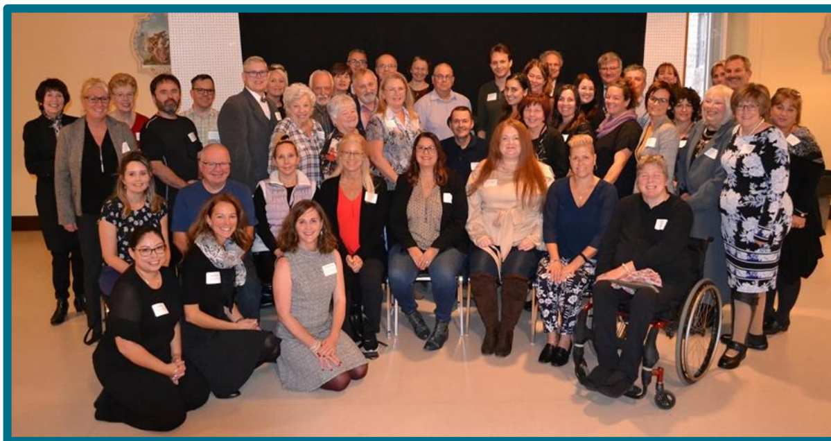
L'événement reconnaissance a rassemblé des usagers partenaires, des gestionnaires, des intervenants et des médecins, qui ont tous travaillé en partenariat de soins et services au cours de la dernière année