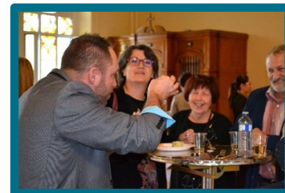
Lors du cocktail, les invités ont eu le plaisir de se faire surprendre par un magicien qui avait plus d'un tour de magie dans son sac!