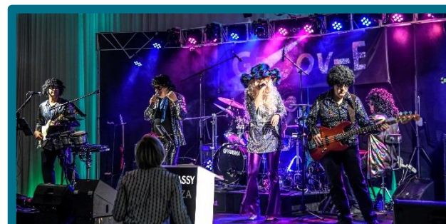
Le groupe GROOV-E