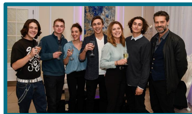
La porte-parole de la Fondation, la comédienne Charlotte Aubin, avec ses collègues de la série L'Échappée