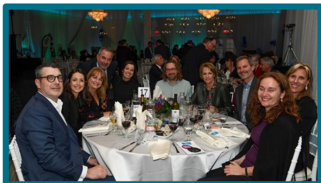
Plusieurs membres de la direction du CISSS de Laval