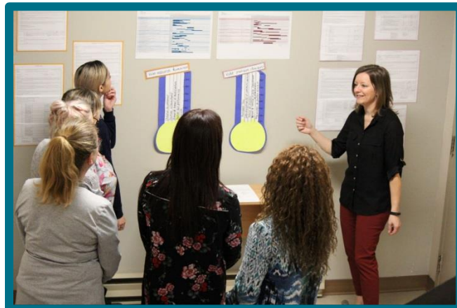
Le plan d'action, qui a été imprimé dans un grand format, a été installé dans la cage d'escalier principale qui est fréquemment empruntée par les membres du personnel

L'atmosphère conviviale de l'événement a aussi permis aux employés de poser des questions sur les changements à venir.