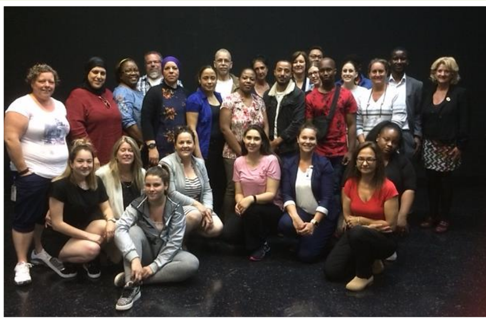
La cohorte 2019

Bravo à tout le personnel qui contribue à rendre ce beau projet possible pour les élèves.