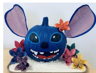
Prix du public (75 $) : unité l'Interlude