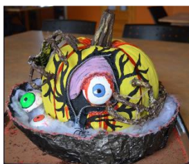
Prix de participation unités pour filles (50 $) : unité l'Oasis