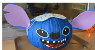
Prix de participation unité pour garçons (50 $) : unité l'Envol