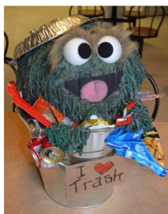
Prix « Coup de cœur » de la Fondation (150 $) : unité le Transit