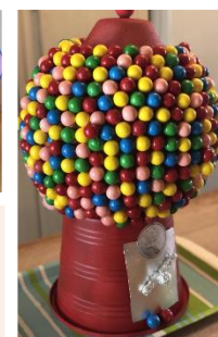
Prix de participation foyers de groupe (50 $) : Foyer Honfleur