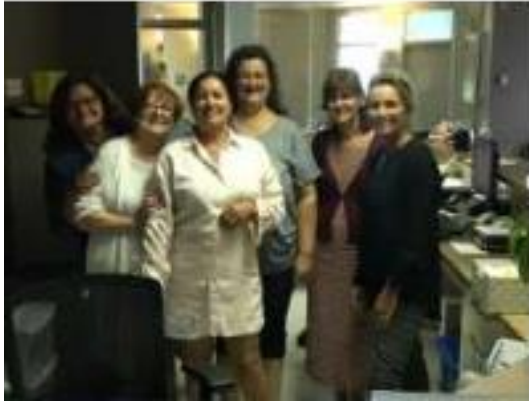
Notre Équipe de secrétariat