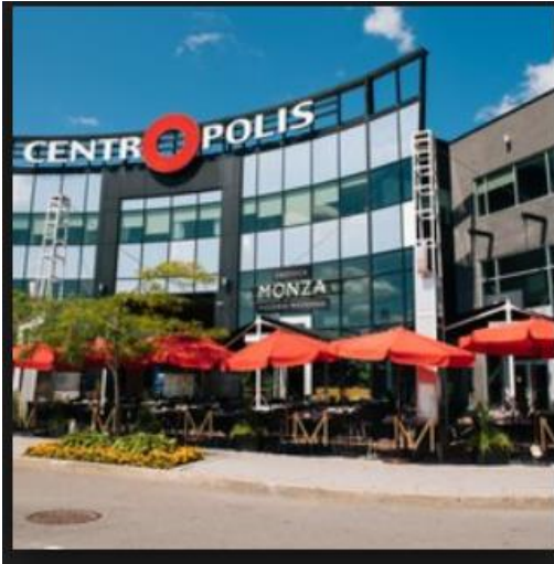
Le Centropolis à Laval